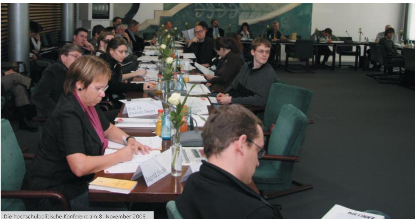
Die hochschulpolitische Konferenz am 8. November 2008