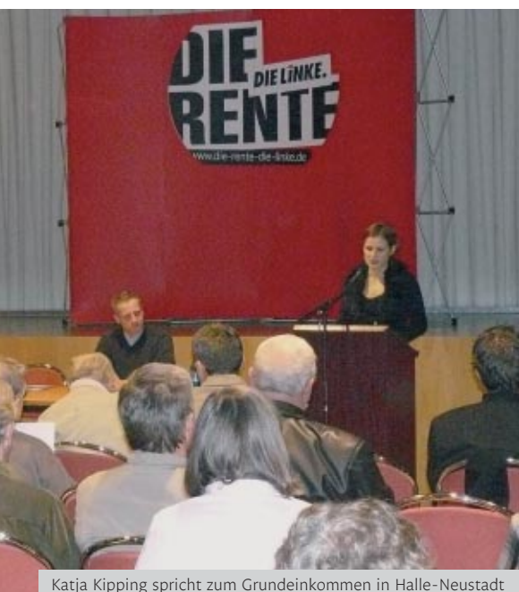
Katja Kipping spricht zum Grundeinkommen in Halle-Neustadt

www.die-linke-grundeinkommen.de www.grundeinkommen.de www.freiheitstattvollbeschäftigung.de