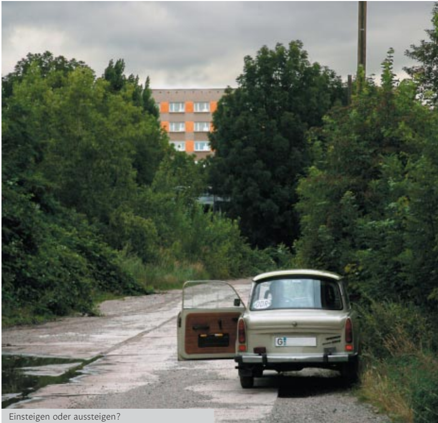
Einsteigen oder aussteigen?

läufig wie die nach der Legitimität des Franco-Regimes, der Französischen Revolution oder der Sowjetunion. Warum wohl?